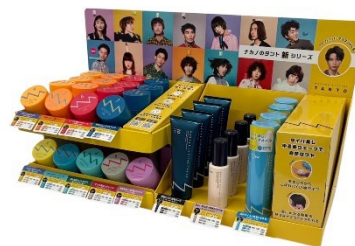
「タント」計12アイテム販売什器