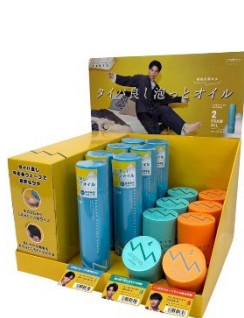
メンズパーマスタイリング向けの3アイテムオリジナルデザイン

メンズパーマスタイリングに最適な3アイテム用のオリジナル什器を展開すると共に、「タント」計12アイテム販売什器も一新。スタイルごとのアイテムの違いを明確に訴求することで、自分らしい“なりたい姿”に合ったアイテム選定のサポートを強化します。